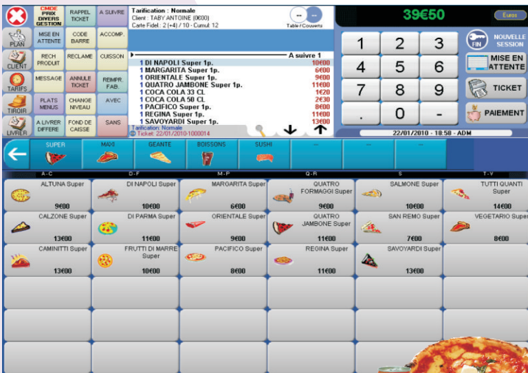
Commande, facturation, encaissement