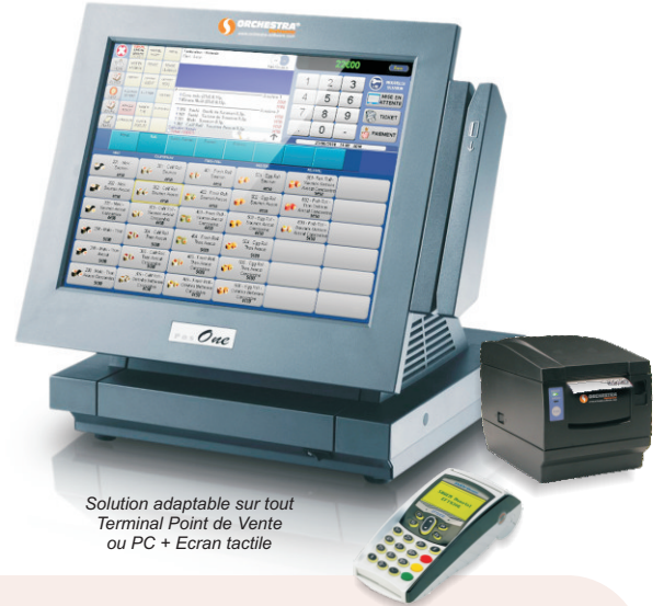
Solution adaptable sur tout Terminal Point de Vente ou PC + Ecran tactile