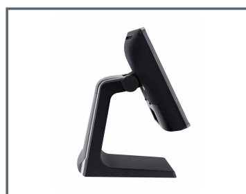
Terminal de diseño.