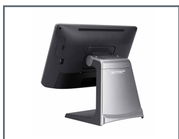
Acabado en aluminio.