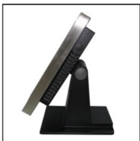
Terminal Estanco Total IP65 -NEMA 3