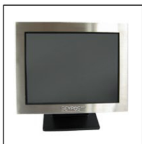
Pantalla ELO TOUCH Resistiva (Sellada contra entrada de líquidos)