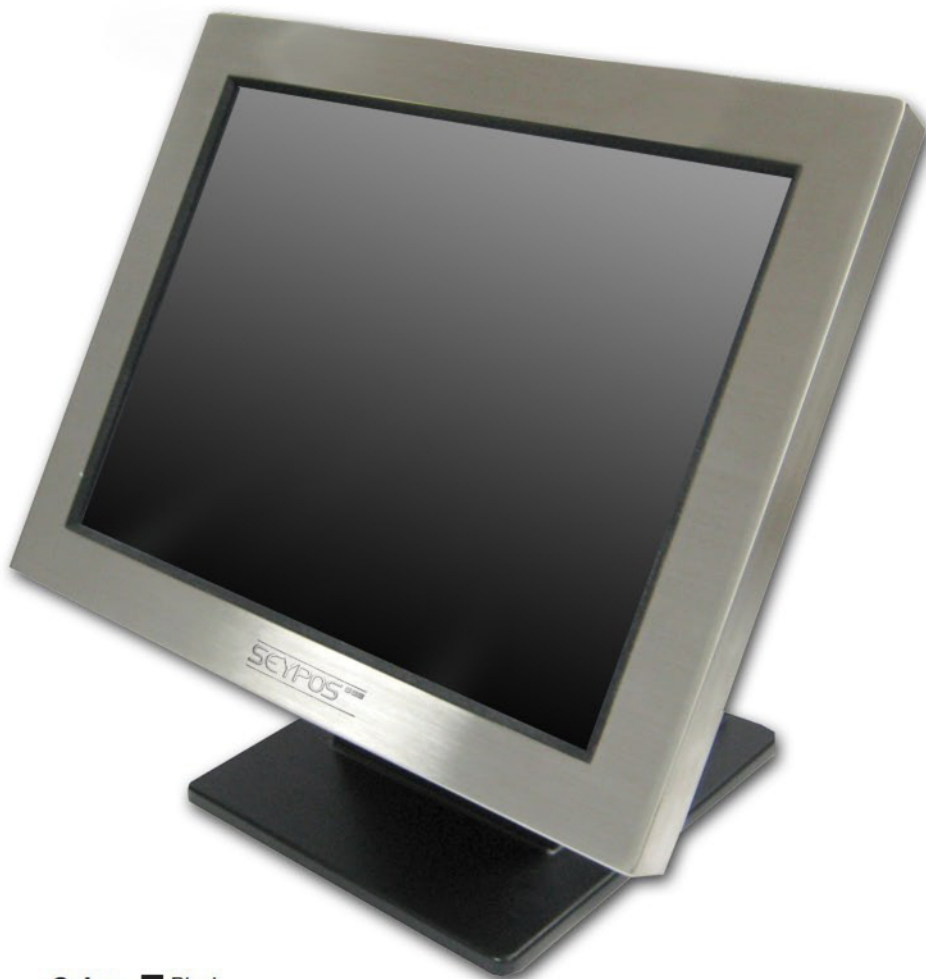
Color: ■ Black ■ Acero Inoxidable